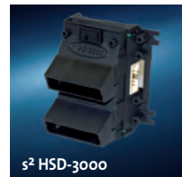
s 2 HSD-3000