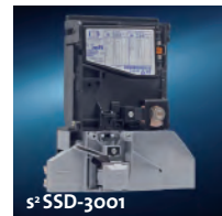
s 2 SSD-3001